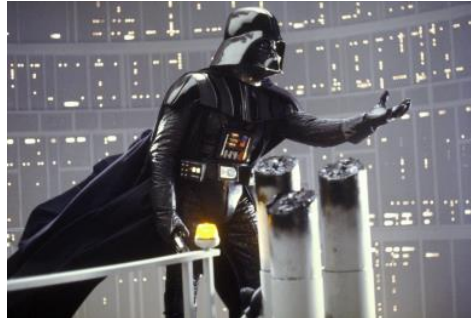
星球大戰：帝國反擊戰音樂會