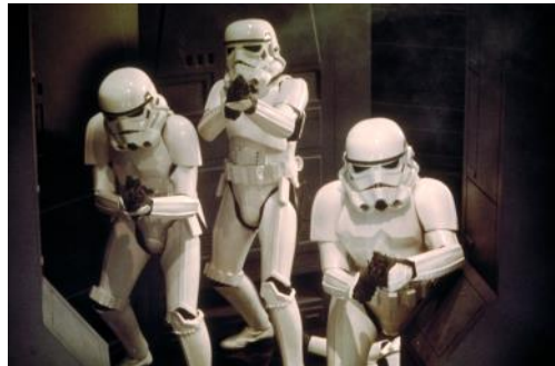
星球大戰：新的希望音樂會